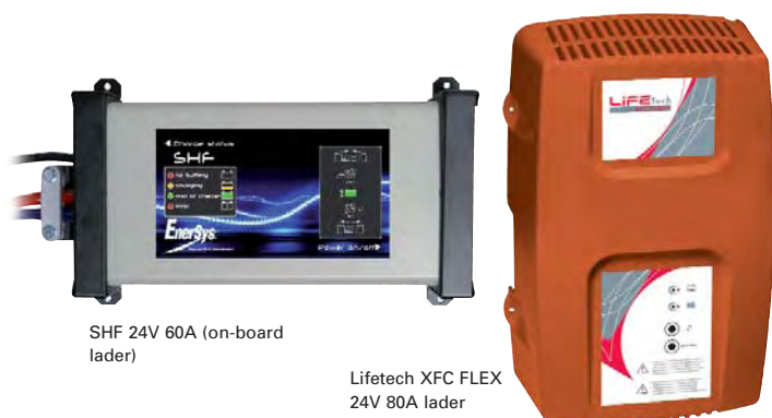
SHF 24V 60A (on-board lader)